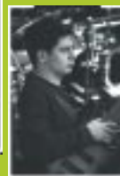
BASSO: Pino Mauel Ingegneria Meccanica