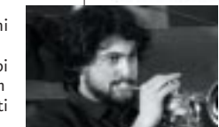
TROMBA: Bruno Marina Ingegneria